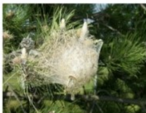
Chenilles processionnaires du pin

Soyez vigilants aux nids de chenilles processionnaires :