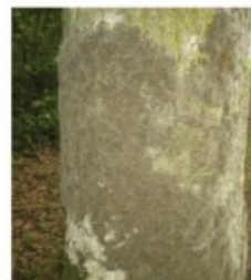
Chenilles processionnaires du chêne