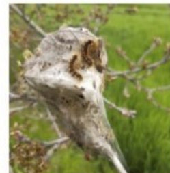
Bombyx cul brun